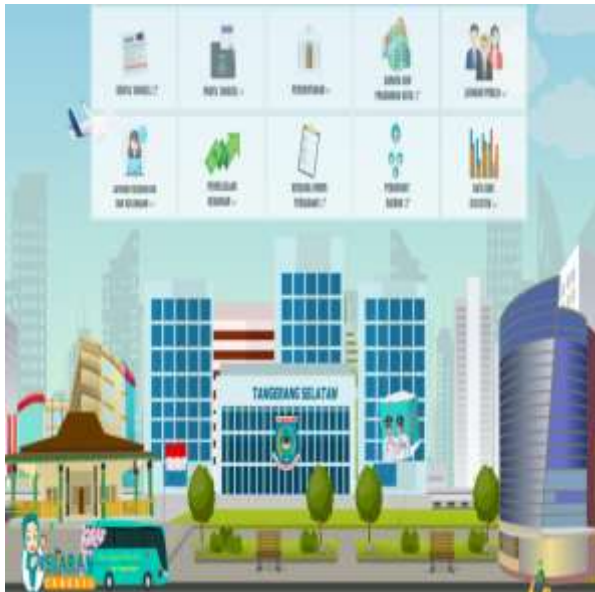
Gambar 1. Halaman awal web Tangerang Selatan