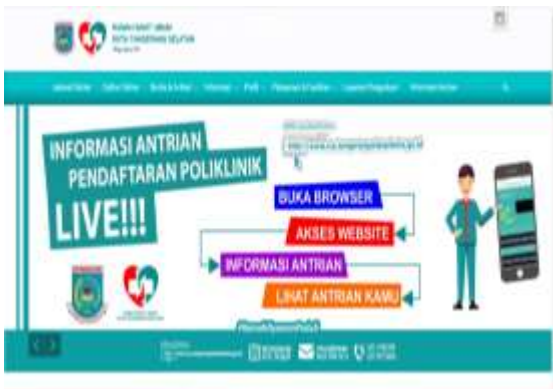
Gambar 2. layanan publik berupa RSUD

Gambar 2 merupakan gambar layanan publik yang terintegrasi dengan web tangerang Selatan. Pada halaman ini masyarakat bisa melakukan pendaftaran secara online terlebih dahulu, serta melihat jadwal dokter yang praktek.